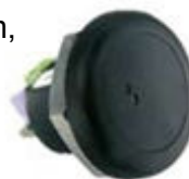
Okrugli antivandal čitač podržan kontrolorom