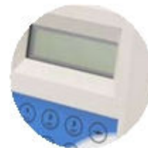
Opciono, ručni terminal za dodavanje ili brisanje ključeva